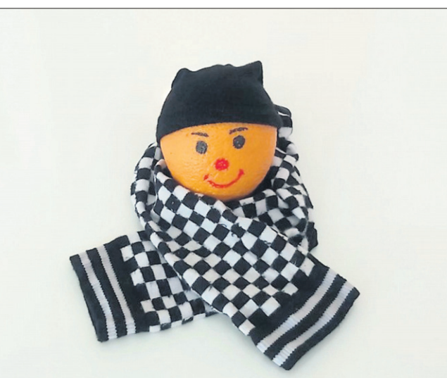
Borna Černe, 7. razred OŠ Stoja