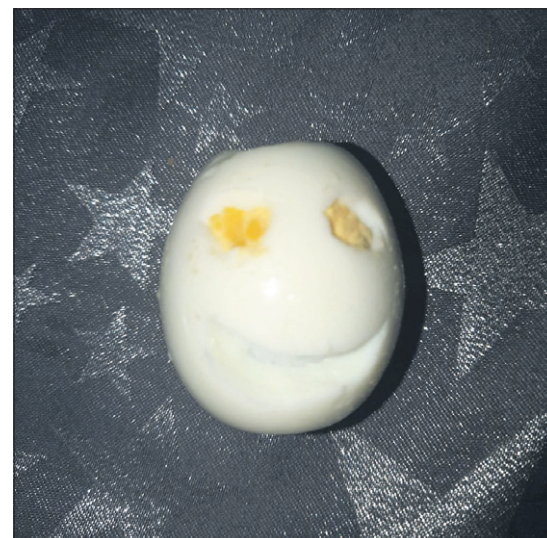
Nika Livak, 5. razred OŠ Stoja

bom u recentnu 25. edukativnu muzejsku akciju, predstavivši svoj program pod nazivom "Šaljemo ti poruku ljubavi". Ovaj put virtualnim se posjetiteljima dala prilika i 'zadatak' da se pobliže upoznaju s izlošcima stalnog postava MSUI kroz seriju dnevnih objava na Facebook stranici MSUI-a.