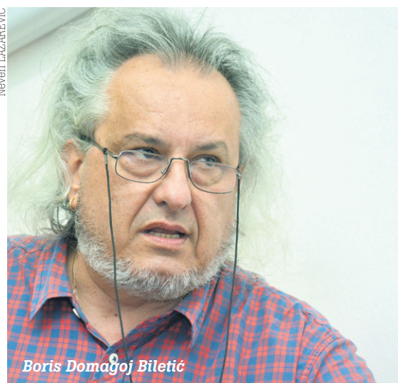
Boris Domagoj Biletić